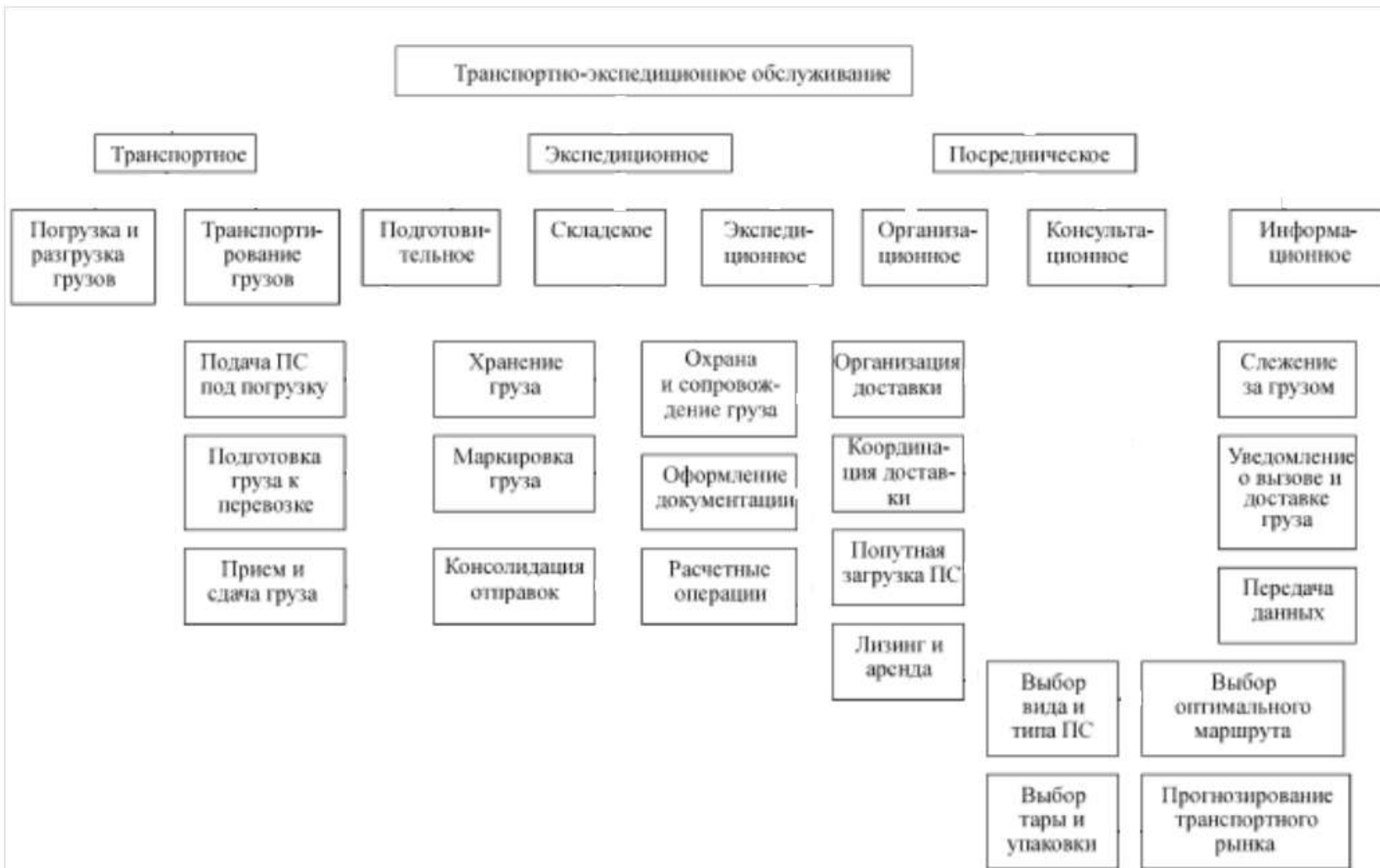
Структура транспортно-экспедиционного обслуживания