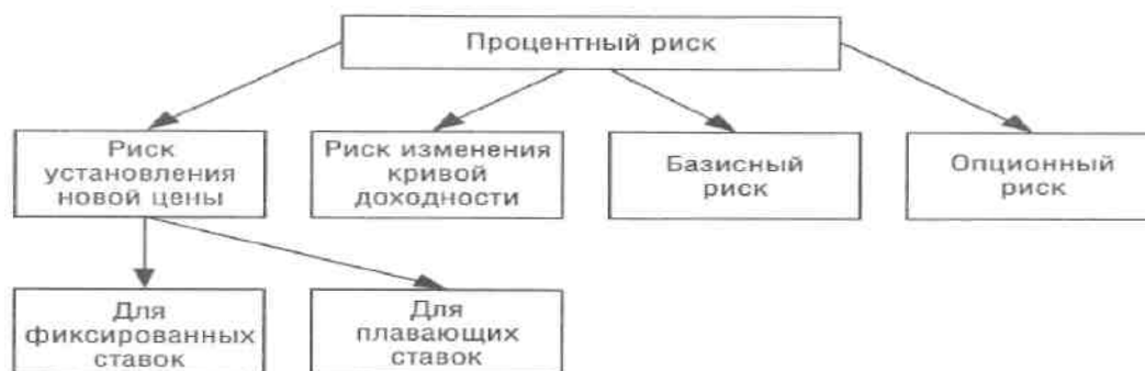
Рисунок 1 - Формы процентного риска